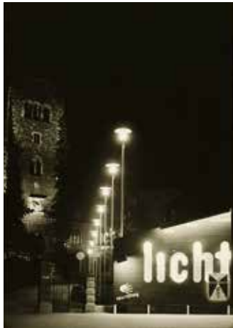
Zürich → 18