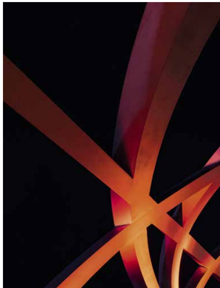
Pont Hans Wilsdorf in Genf, zu mitternächtlicher Stunde