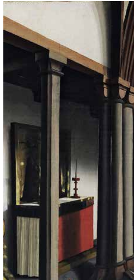
Brennende Kerzen am Altar. Konrad Witz, Die Heiligen Katharina und Magdalena in einem Kirchenschiff, Strassburg Musée de l'Œuvre Notre Dame, 160 x 130,4 cm, Mischtechnik auf Tannenholz, um 1440/1445.

das Licht Christi, das sich in der dunklen Westwand als Lichtkreuz abzeichnet. Das über einer dreischiffigen Krypta hoch erhobene Presbyterium bleibt zu allen Tageszeiten die am hellsten beleuchtete Partie des Gebäudes. Dies wird mittels der relativ bodennah angelegten Fenster erreicht, obwohl diese sehr schmal sind und asymmetrisch nur auf der Mittelachse der Apsis und auf der Südseite angelegt sind. 4 Das in äusserst reduzierter Form in das Gebäude eindringende Tageslicht konzentriert sich im Altarraum und operiert im Verhältnis zum Langhaus mit starken Hell-dunkel-Kontrasten. Lucem demonstrat umbra – «Erst der Schatten zeigt das Licht» 5 – ist ein im Mittelalter an Sonnenuhren geläufiger Sinnspruch, der auch den Effekt des Entzugs als Strategie zur Wahrnehmungssteigerung des Lichtes im Kirchenraum zu beschreiben vermag.