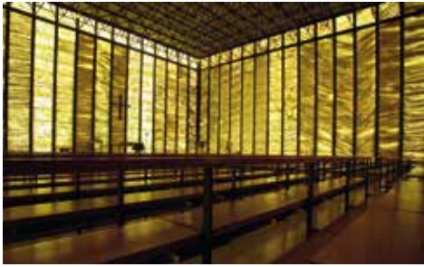
Meggen → 8