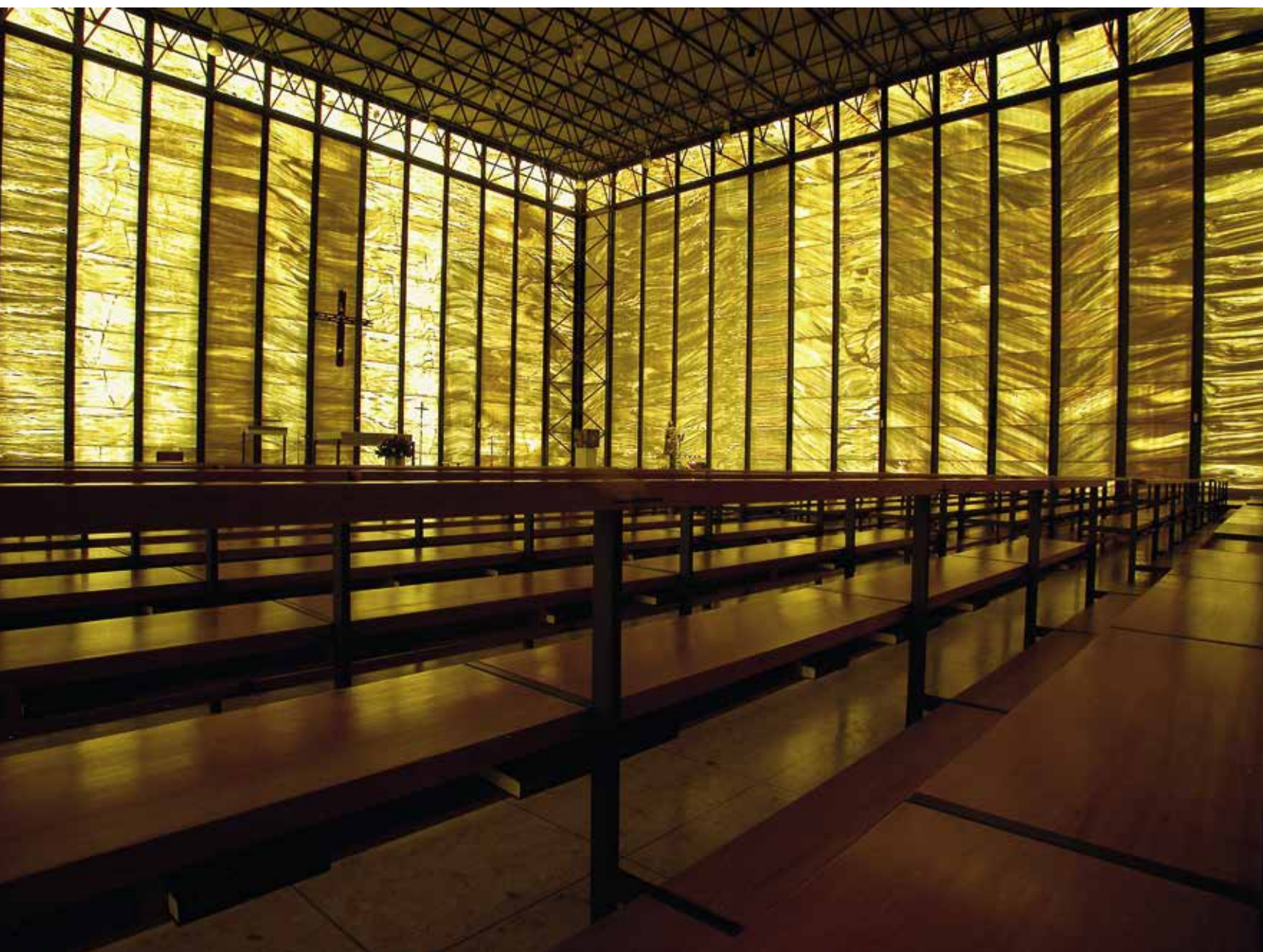
Piuskirche in Meggen von Franz Füg (1964–1966).

Die Lichtregie der Klosterkirche von Königsfelden nach Fertigstellung all ihrer Glasmalereien kurz nach 1340 war durch ein dichtes, vielfarbiges, tageslichtfremdes Licht geprägt; der Chor – zugleich der jüngste Bauteil – war zwar heller als das Langhaus, das in seiner Erstverglasung vollständig ornamental ausgeführt war, der Kontrast zwischen den Räumen des Lichts und der Dunkelheit blieb jedoch wesentlich weniger ausgeprägt als bei Sakralbauten der Romanik.