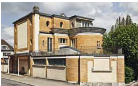
La Chaux-de-Fonds → 20