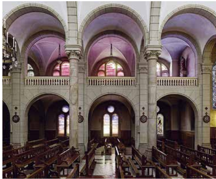
Judith Albert und Gery Hofer, «Ciel/Sky», neue Fenster für die katholische Kirche Sacré-Cœur, Montreux 2008–2010. © 2013, ProLitteris, Zürich.