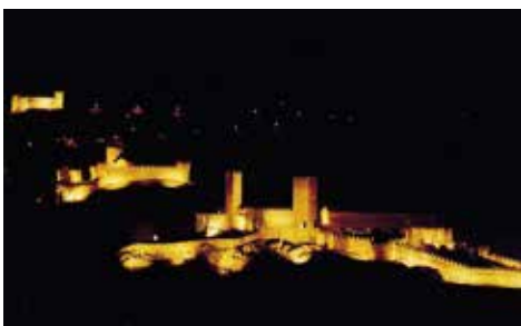
Bellinzona → 36